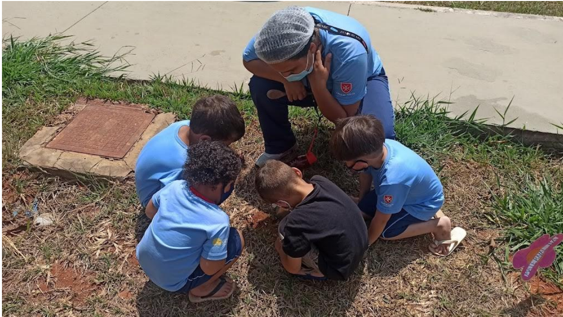
A primavera chegou! Plantio de girassol Maternal II A