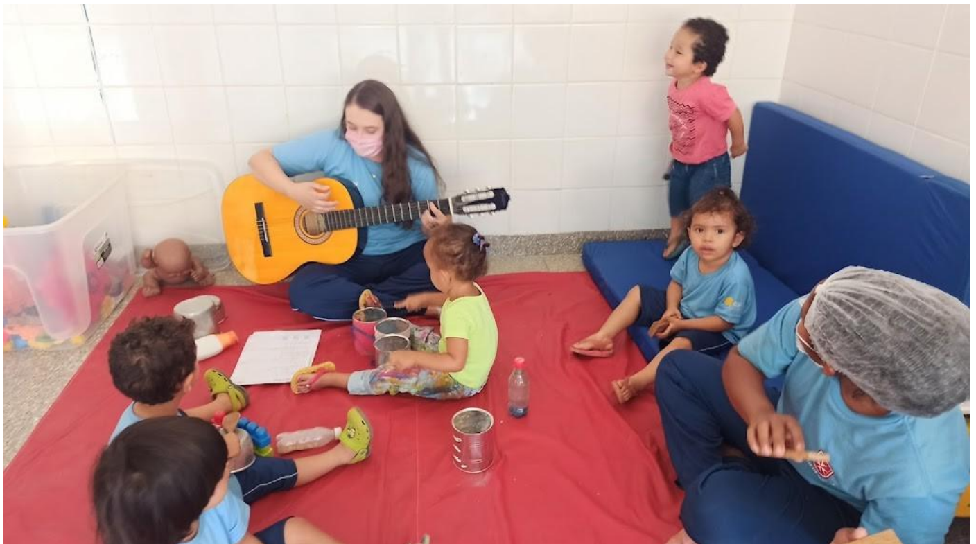
Musicalidade das infâncias - Roda com instrumentos confeccionados com materiais alternativos