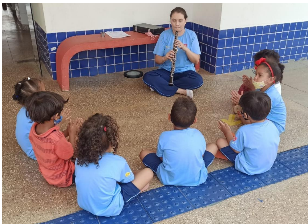
Conhecendo os instrumentos convencionais, o oboé. Maternal II C