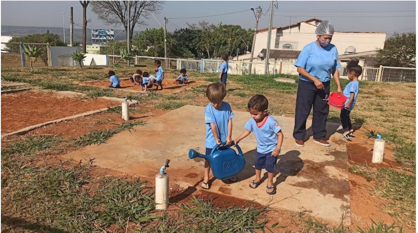
Contato com a terra Maternal I