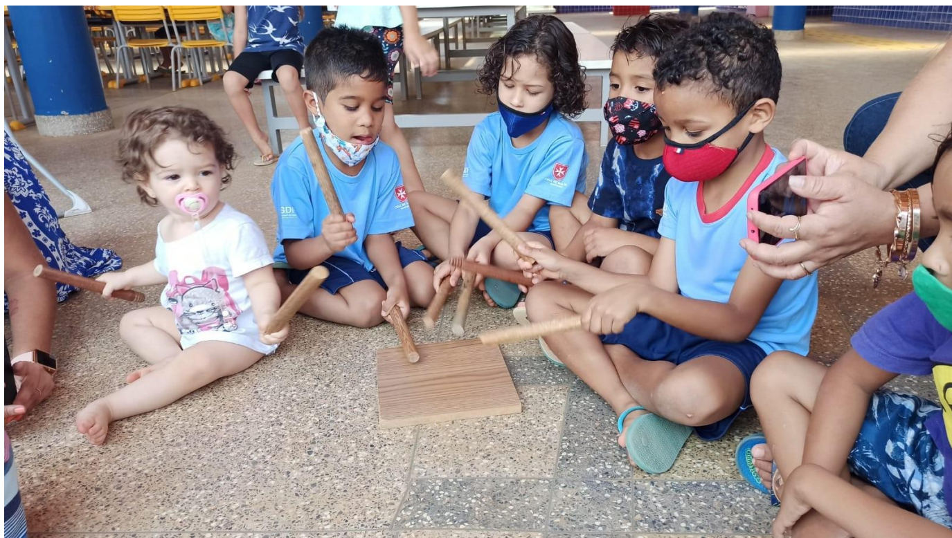
Musicalidade das infâncias II Período A e Berçário I